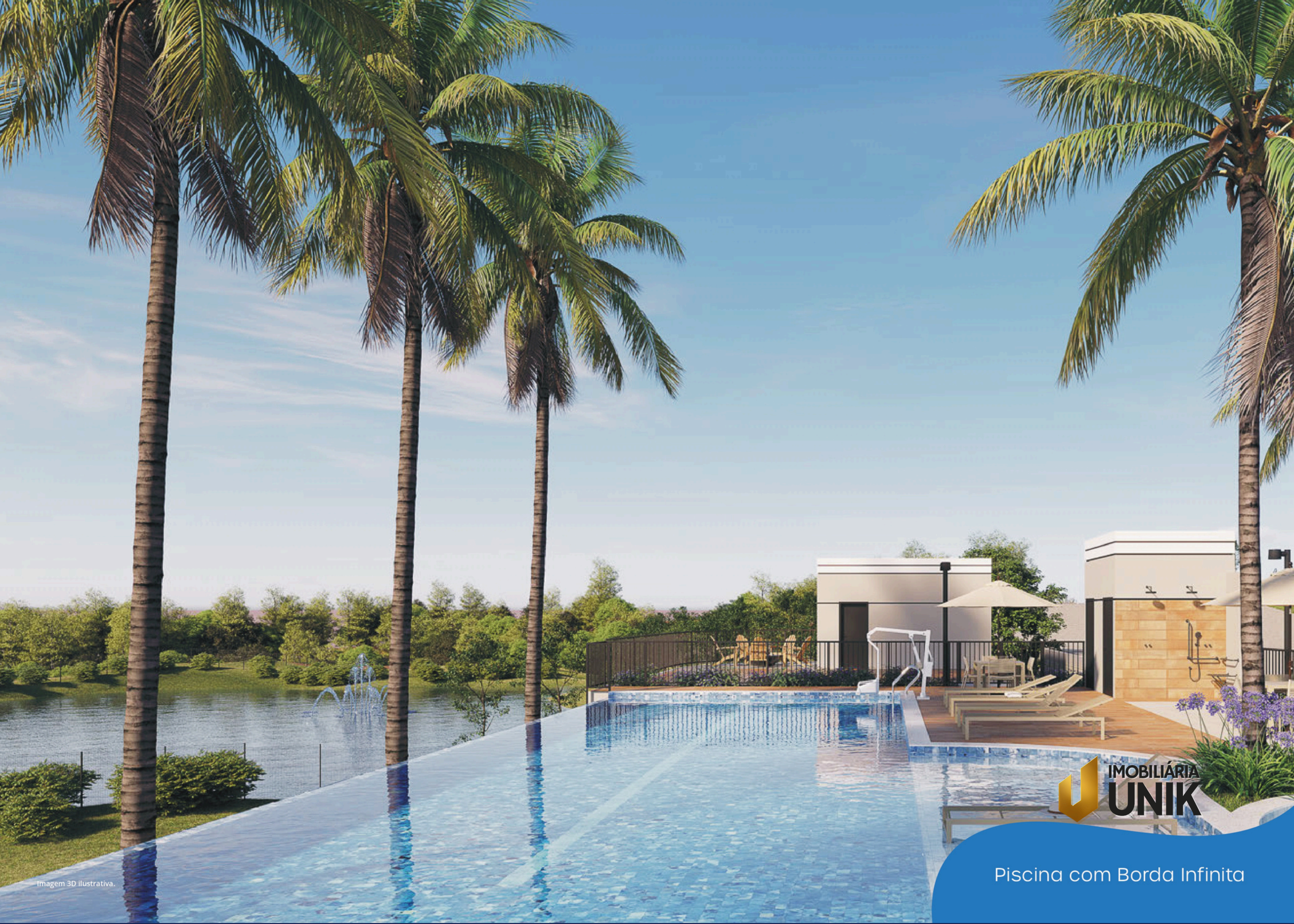
Imagem 3D ilustrativa.