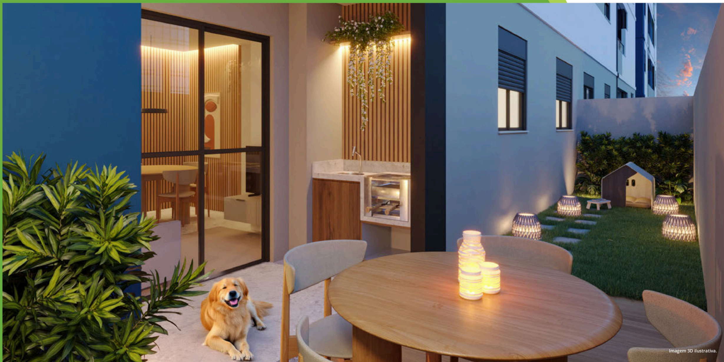
Imagem 3D ilustrativa.