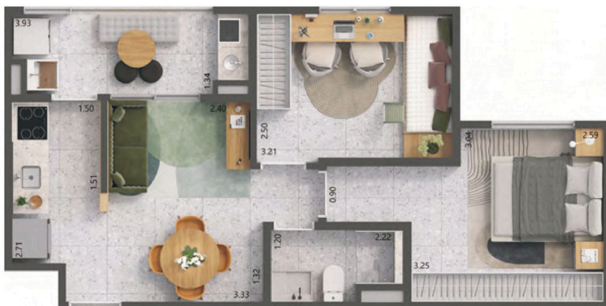
Apto. Meio opção sem Suíte 46,13 m²