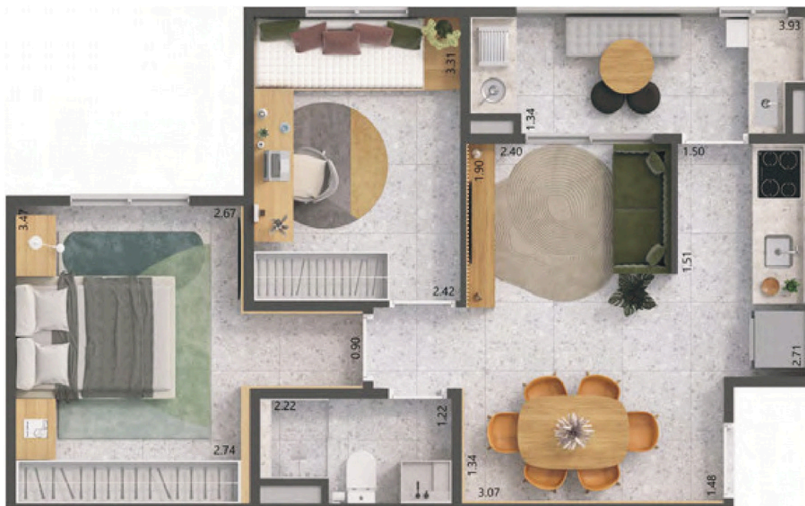
Apto. Ponta 47,78 m²