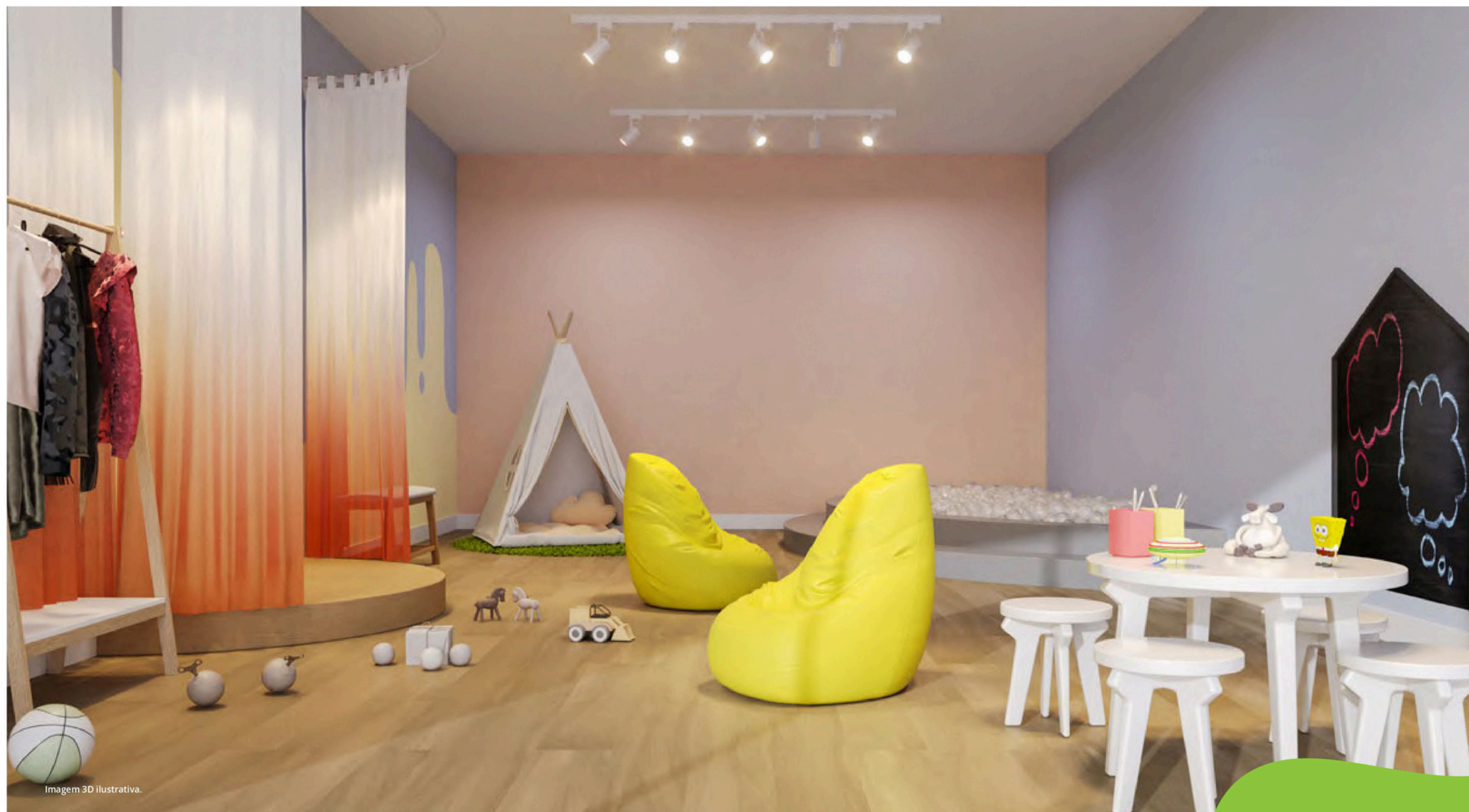
Imagem 3D ilustrativa.

Espaços seguros e cheios de diversão para as crianças crescerem, correrem e explorarem com liberdade.