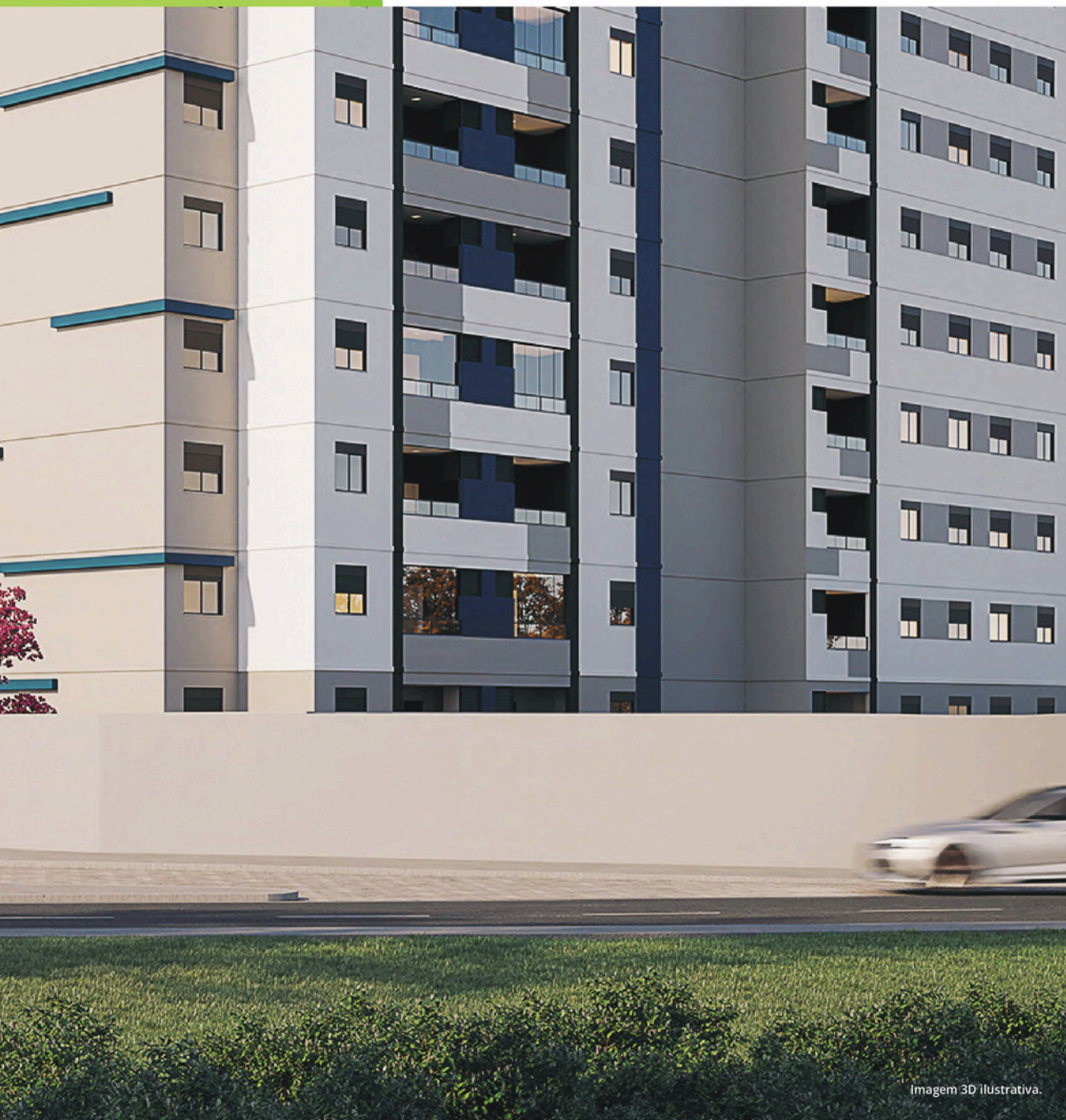
Imagem 3D Ilustrativa.